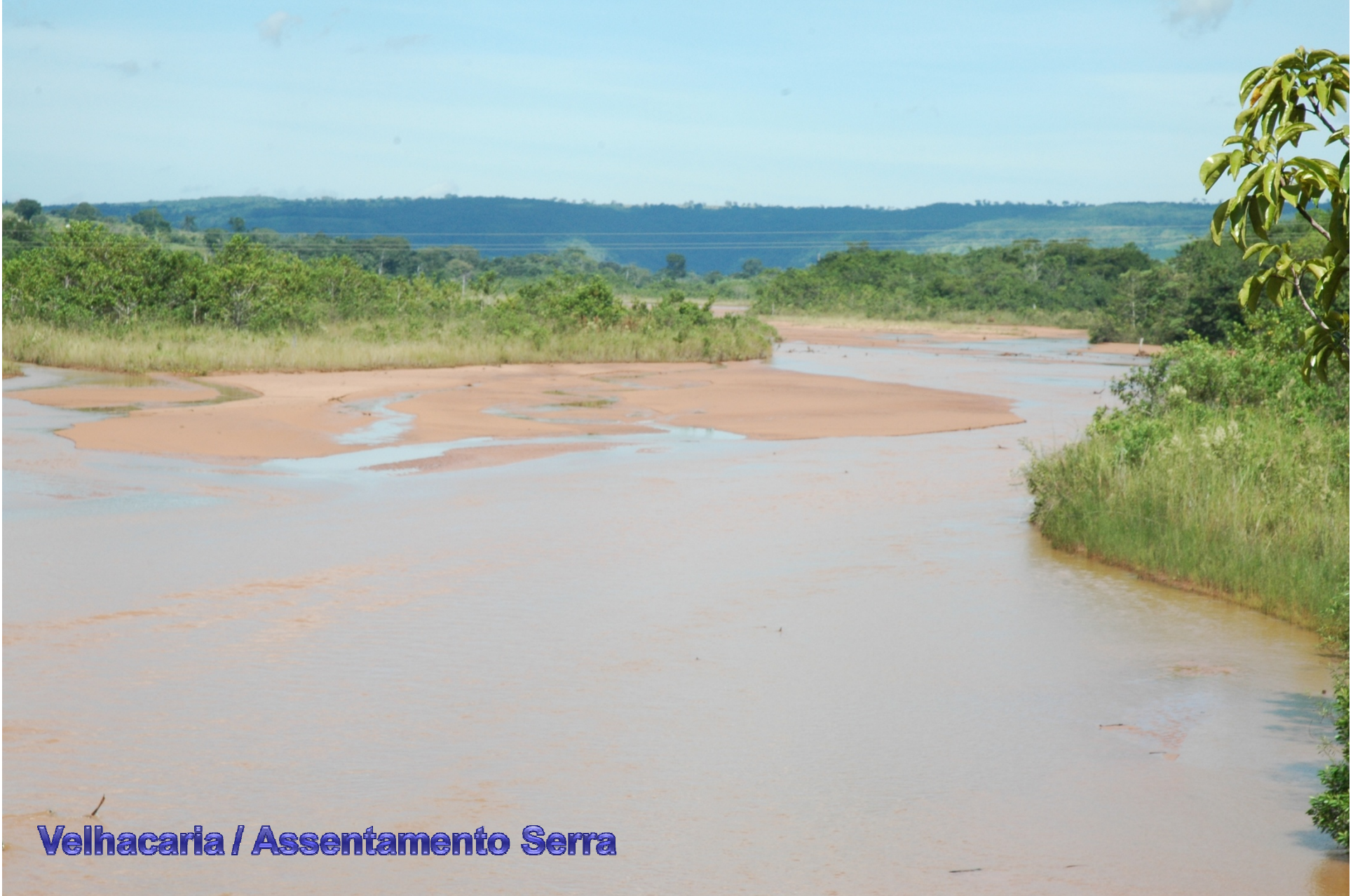
Velhacaria / Assentamento Serra